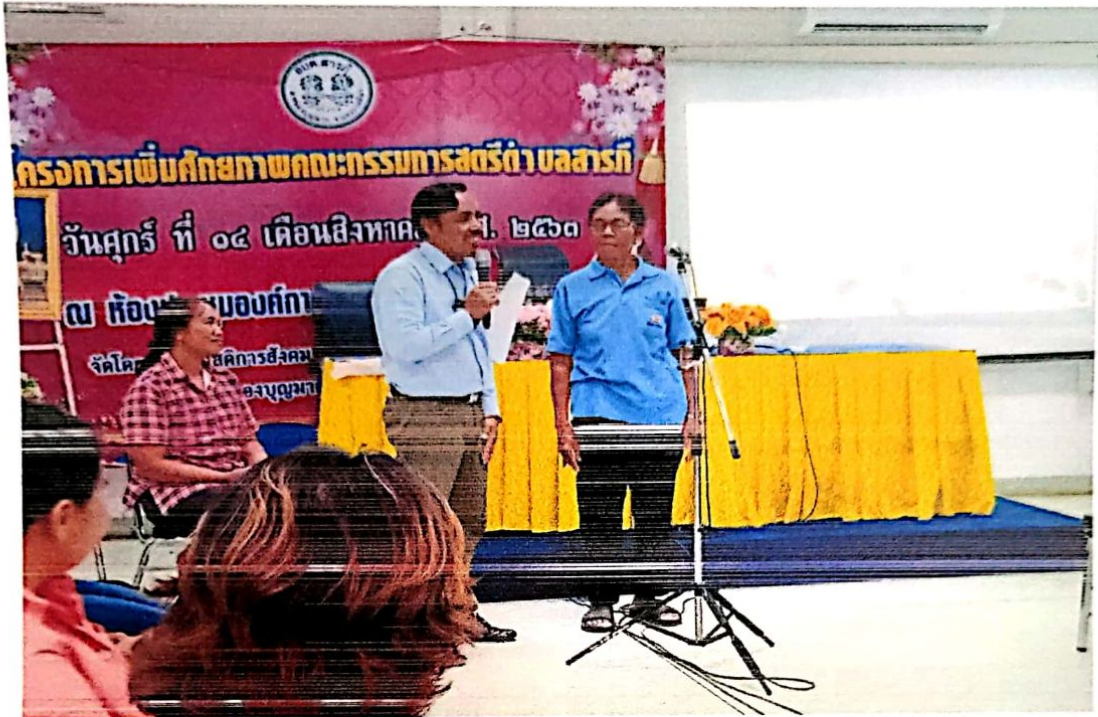
ภาพถ่าย ผู้เข้าร่วมโครงการเพิ่มศักยภาพคณะกรรมการสตรีตำบลสารภี